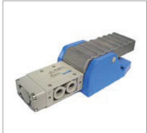
Códigos en Negrita : entrega inmediata, salvo ventas.