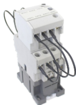
Para CT9 a CT40 For CT9 to CT40 CTC-9