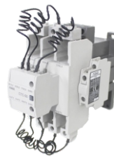
Para CT50 a CT85 For CT50 to CT85 CTC-50