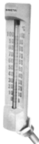
Angulo Obliquo (g)