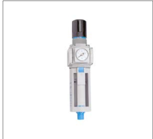
Códigos en Negrita : entrega inmediata, salvo ventas.